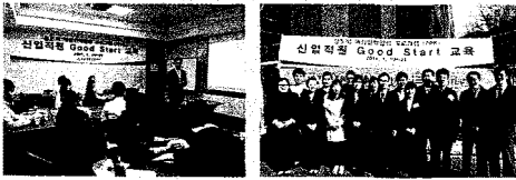
(지금은 교육 중)