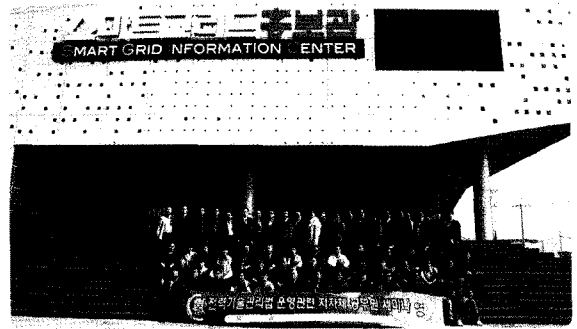
전력기술관리법 운영관련 지자체 공무원 세미나