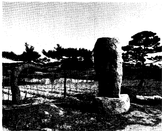
도로변에 세워진 송강조정경 간판과 농장