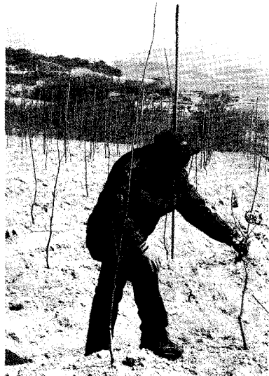
금년에 식재한 대왕참나무 포지