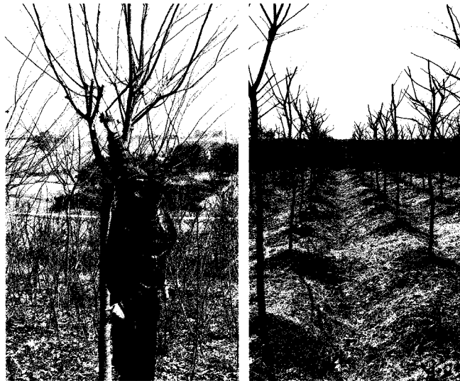
느티나무 전지방법 설명

재배 간격은 최대한 넓게 소식 한다. 보통은 밀식을 하고 수하식재를 하여 한 본이라도 더 심으려 하지만 그는 처음부터 넓게 오와 열을 맞춰 소수의 명품 대경목 생산을 목표로 한다. 밀식하여 우선 큰 것만 추려서 판매하다보면 나머지 불량목들은 그냥 폐기 하는 일이 많아 전량 최상급을 생산하기 위해서는 소식 재배 후 정해진 줄에 있는 것만 먼저 출하하면 항상 간격도 넓고 일정하게 되며 단위면적당 수익성이 높은 대형 조경수가 생산 된다.