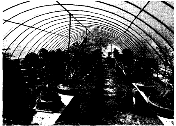
조경수재배에 가장 큰 영향을 받은 누님덕 분재원

주로 남방식 고인돌인 관계로 무심코 지나다 보면 야산이나 논, 밭 심지어 마을 주택가에 까지 흩어져 있어 그저 단순한 자연석으로 착각되는 커다란 돌들이 많지만, 북방식, 개석식, 위석식 등 8가지 형태의 고인돌들이 혼재된 고창이다. 고창군내에 2,000여기가 있고 특히 그의 고향이며 농장이 자리한 아산면에는 집단적으로 400여기가 모여 있다니 일찍이 선사시대부터 정착 농경생활이 발달하였고 지금도 농업 분야에서는 항상 앞서 가는 선구자의 역할을 해오는 곳이 이곳 고창이다. 멀리는 “동학농민혁명”에서도 이곳 고창지역 집강소가 가장 강한 세력으로 봉기하였으며, 근래에는 모든 지역이 식량작물 재배에 매달릴 때 과감하게 복분자 딸기를 재배하여 지금의 건강 사회에 걸맞는 최고의 소득 작물을 개발해 내었고, 야산을 개간 유명한 황토 수박 단지를 이룬 곳도 이곳 농민들이며 조경수 또한 해풍을 받고 온난화가 적당한 기후에서 자라 전국 어디를 가도 생육이 잘되는 장점이 있어 많은 이들이 저마다 고품질의 조경수들을 생산하는 “조경수 집단 생산 단지화”를 이룩한 곳이 고창으로 그 많은 조경인들 속에서도 이곳 유승환 사장의 송강조경농장은 가장 흔한 일반 수종으로 명품 조