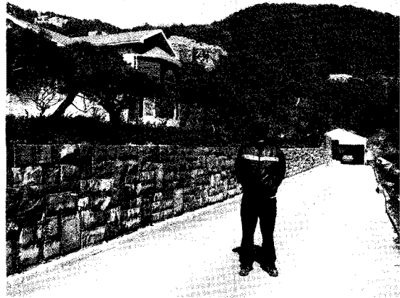
처음 조정기술을 배운 누님댁 농장전경

처음 6~7년간은 양계장 사업과 겸하면서 주로 회양목 등 단기 수종 재배와 이따금 산림 훼손지에서 나오는 자연생 소나무들을 소량씩 굴취, 가식한 후 판매하면서 조정수들은 수형이나 품질에 따라 많은 가격 차이가 있는 것에 착안 특수한 고급 수종이 아니라도 수형과 품질이 뛰어난 "명품 조정수"만 생산하면 성공할 수 있다는 확신을 가지고 양계장은 접고 일반적 대표 수종인 느티나무와 대왕참나무 그리고 메타세콰이어 이렇게 3종을 선택, 조정수 재배에만 전념하면서 경운 방법, 식재 간격, 전지와 수형 조절, 비배 관리 등을 여러가지 방법으로 시도하고 터득해 나가면서 인근 농장과 선배 조정수들을 찾아가고 멀리 있는 모범 농가와 연구, 교육 기관 등을 방문하여 기술과 요령을 터득하고 일본 유학했던 경험을 살려 선진 기술을 도입하는 등 실패와 좌절을 맞본 끝에 나름대로의 재배 노하우를 터득, 지금의 소수정예 명품 조정수 농장으로 태어났다.