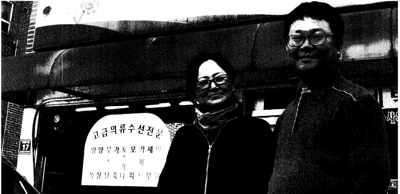
취재지원 : 근로복지공단 경인지역본부