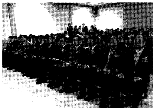
△ 한국파렛트컨테이너산업대상 수상자