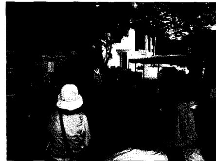
〈그림 4〉 그린리더양성과정 워크샵 “통영 언대도 에코아일랜드를 찾아서”