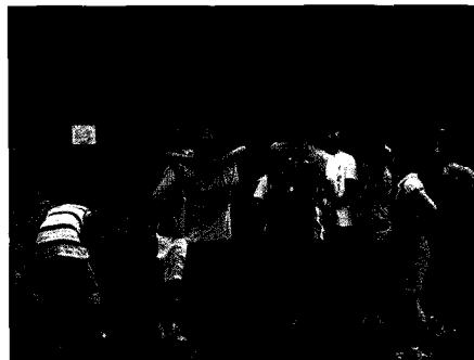
〈그림 5〉 어린이 기후학교-기후캠프 “생명의 숲 체험”