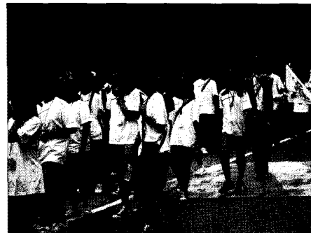
〈그림 2〉 제3회 청소년 경안천 대탐사 “경안천 물길따라”