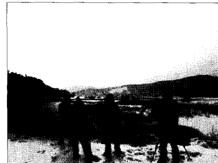
〈그림 6〉 생태도감시리즈 4 “용인새이야기” 경안천 새탐조