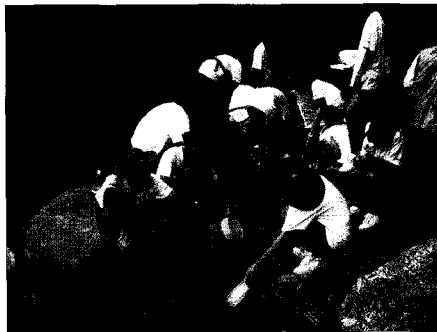
〈그림 3〉 제3회 청소년경안천대탐사 “경안천 발원지를 찾아서”