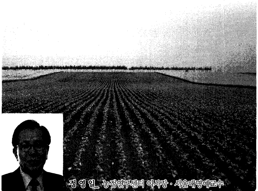
정영인 농정연구소 이사장 · 서울대 명예교수