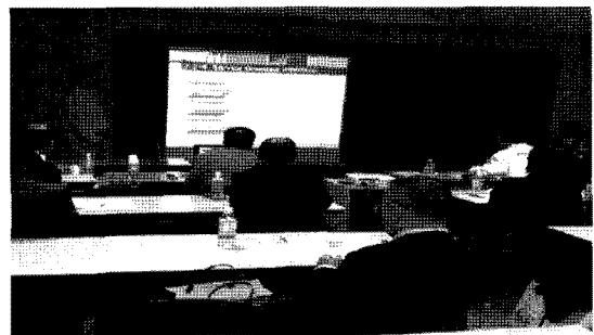
▲ 제4분과 발표전경