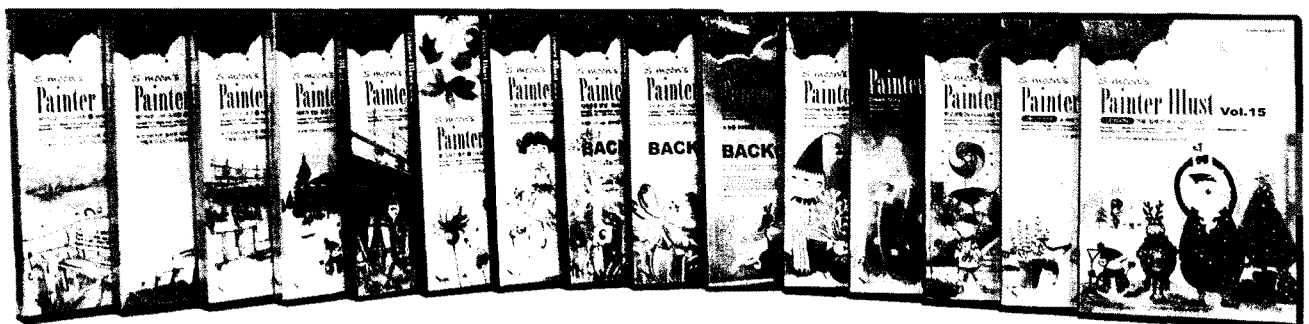
▲ 세방기획에서 출시한 에스문 페인트 일러스트 CD