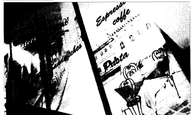
▲ 벽지·롤스크린에 페인트 일러스트를 적용한 모습