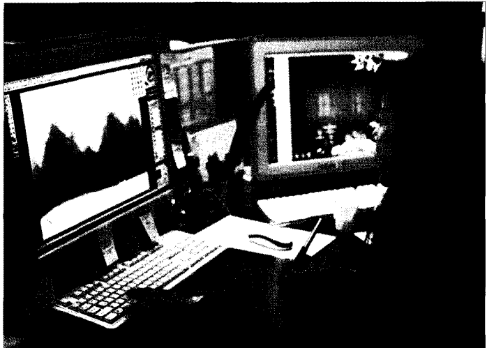
▲ 작업중인 고재은 대표(위)와 박점문 팀장

서 풍부한 질감과 감성을 가진 콘텐츠다. 각각의 레이어가 분리되어 있어 사용하기에 편리하고, 확대하여도 선명한 해상도를 유지합니다. 또한 어떤 제품, 어떤 장소에서도 조화를 잘 이루고 아름다운 공간을 연출내는 감성적 콘텐츠다. 특히 벽지나 톨스크린과 같은 대형 제품에 사용하여도 원본 그대로의 퀄리티를 유지하며 크게 확대하여도 질감과 색감이 살아있다.