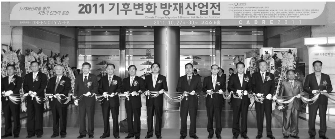
〈2011 기후변화방재산업전 개막식〉

내년도 2012년 기후변화방재산업전은 "방재의 날(5.25)"과 연계하여 시기,장소를 검토하여 추진할 계획이다.