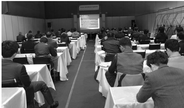
〈제4회 자연재해저감기술발표회 전경〉