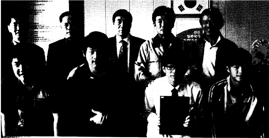
▲ 천안공고 장학금 수여식