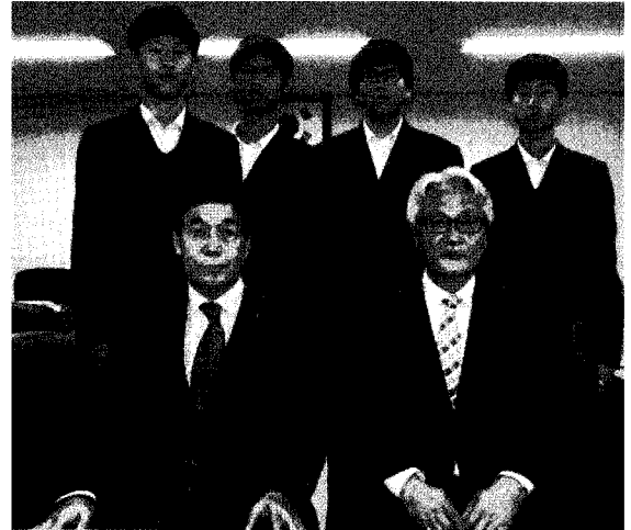
▲ 충남기계공고 장학금 수여식

대전·충남도회(회장 황광연)는 지난 9월 27일과 11월 15일 각각 천안공업고등학교(교장 임승훈)와 충남기계공업고등학교(교장 정충호)를 방문하여 성적이 우수하고 학교생활에 모범을 보인 8명의 학생에게 총 400만원의 장학금과 장학증서를 수여했다.