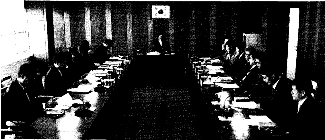
▲ 서울특별시회는 지난 11월 24일 설비건설회관 중회의실에서 제242차 운영위원회를 개최했다.

서울특별시회(회장 이상일)는 지난 11월 24일 설비건설회관 중회의실에서 제242차 운영위원회를 개최하고 △장학금 지급내규(안) 제정의 건 등 부의사항을 논의했다.