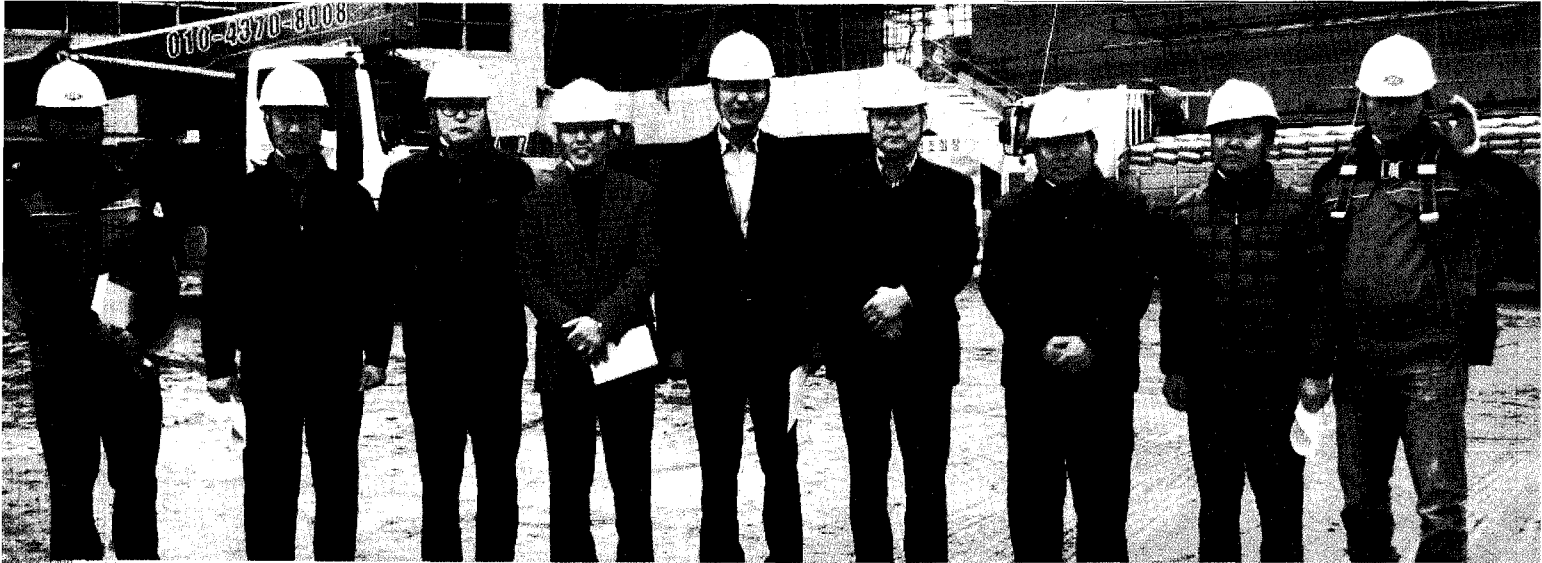
▲ 강원도회 시공품질점검위원회는 지난 11월 22일 '춘천여고 이전 신축 기계설비공사' 현장을 방문, 시공품질현장 점검을 실시했다.