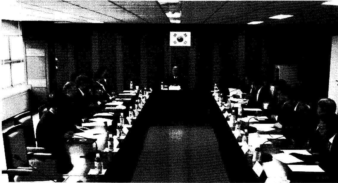
▲ 대한설비건설협회 플랜트설비공사협의회는 지난 11월 18일 설비건설회관 총회의실에서 제 22차 회의를 개최했다.

대한설비건설협회 플랜트설비공사협의회 (위원장 송기영)는 지난 11월 18일 설비건설회관 중회의실에서 제22차 회의를 개최하고, 6명의 신임 간사에게 선임장 수여했으며 상견례를 가졌다.