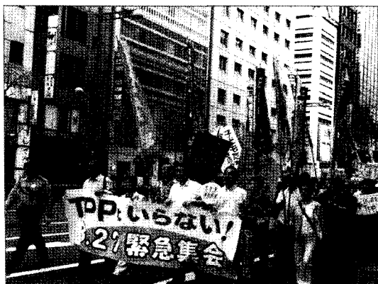
▲ 동경 긴좌의 집회행진

이 Codex위원회의 잔류농약기준이 도입되면, 포스트하베스트 농약기준이 크게 완화되어 잔류농약 투성이인 수입농산물이 당당히 수입될 것이다.