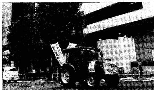
▲ 동경전력 본사 앞의 트랙터 시위

이와 같이 많은 문제를 안고 있는 TPP참가를 어떻게 해서라도 저지하고자 사진과 같이 8월 27일에는 동경에서 많은 사람들이 모여 집회를 열었다. 수상의 교대로 점점 위험성이 높아진 일본의 TPP참가를 국민의 힘으로 어떻게 그만둘 수 있게 해야 할 것이다. ㉞