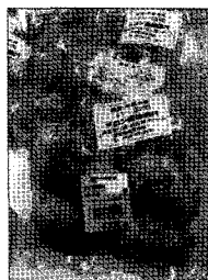
▲ 직매소에 출하한 적과메론의 장아찌. 시원한 맛으로 인기가 높다.

딸기는 겨울의 수개월이지만, 수확이 시작되면 하우스 앞에 깃발을 세워두면 그 깃발을 보고 제사를 지내는 사람들이나 외부로 나갈 때 선물 등으로 집락사람들이 사간다. 1팩(300g)에 500엔으로 판매액은 약 70만엔 정도이다. 최근에는 딸기잼을 가공하여 판매하고 있으며 약 10만엔 정도이고, 총 80만엔 정도의 매상을 올리고 있다. 토마토는 미치노에키(道の驛)에 절반, 집락내에 절반으로 집락내의 매상은 약 40만엔 정도이다.