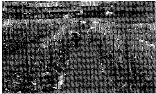
▲ 가지의 수확작업, 여성이 많고 즐거운 소리가 들리고 있다.

이(飯)집락은 시가현 동북부 비와호(琵琶湖) 근처의 넓은 논농사지역의 안에 있다. 마을 전체의 가구수는 110가구의 작은 마을이다. 대부분이 겸업농가로 한 농가가 소유하고 있는 농경지의 평균면적은 3反(약 1,000평정도)이고, 교토(京都)까지 전차로 50분, 오오사카(大阪)까지 1시간반정도의 지역으로 통근하는 사람이 많았다. 최근에는 주말이나 휴일에 가벼운 마음으로 농사를 짓는 사람도 감소하는 추세이다.