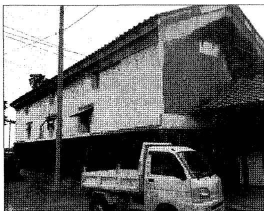
▲ 집락의 비축미를 저장하고 있는 주정 창고

팜에서는 재해시를 준비하는 것으로 비축미를 확보하고 있다. 집락사람들이 최저 3일간 먹을 수 있는 600kg을 집락내의 양조장에 보관하고 있다.