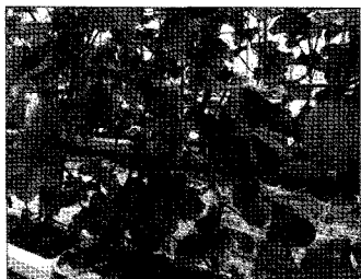
▲ 벼 육묘하우스에서 여름에는 멜론을 재배. 박스재배도 최고의 맛을 낸다. 집락사람들에게 예약 판매.

쌀만이 아니다. 팜에서는 채소도 집락 내에서 판매하고 있다. 벼의 육묘하우스를 이용하여 생산하는 메론, 토마토, 딸기는 입소문이 퍼져 대부분 예약으로 판매가 완료된다. 4동의 육묘하우스의 면적은 전부 합하여 약 300평정도로 작지만, 예를 들어 메론은 추석연휴 때에 수확을 할 수 있도록 시기를 조절하고 있다. 이렇게 하면 고향에 내려온 사람들이 돌아갈 때에 선물로서 대부분 판매가 되고 있다. 1개 1,200엔 정도로 전체 판매액은 약 60만엔에 이른다.