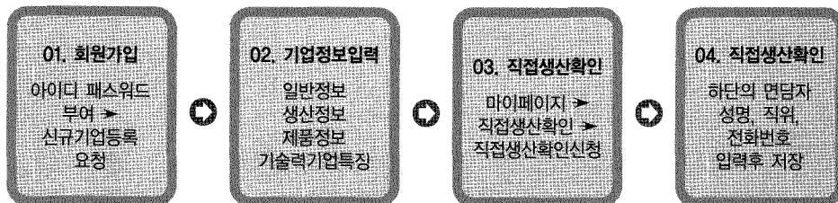
표1. 직접생산확인 신청절차