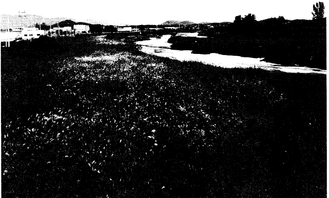
〈그림 7〉 북하천교 하류부 전경 : 수변 식생과 퇴적하상 등 자연 하천의 모습을 나타내고 있다.