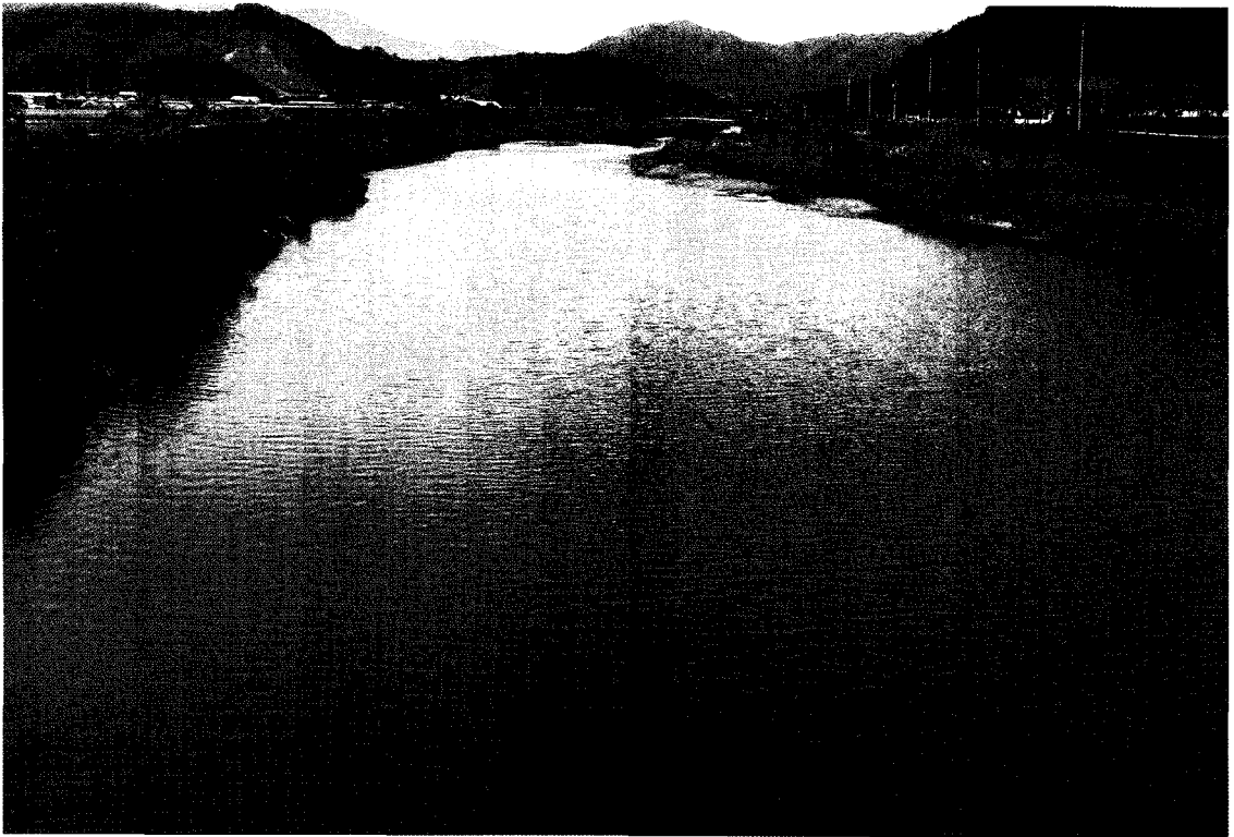
〈그림 9〉 북하천 매곡교 상류부 전경 : 하천에 상시 흐르는 물의 양이 비교적 넉넉한 모습을 보인다.