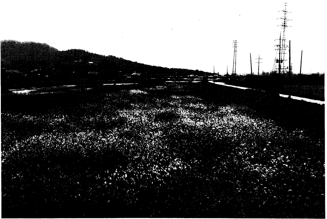
〈그림 6〉 북하천교 상류부 전경 : 수변 식생역이 넓게 분포하는 특색을 보이고 있다.