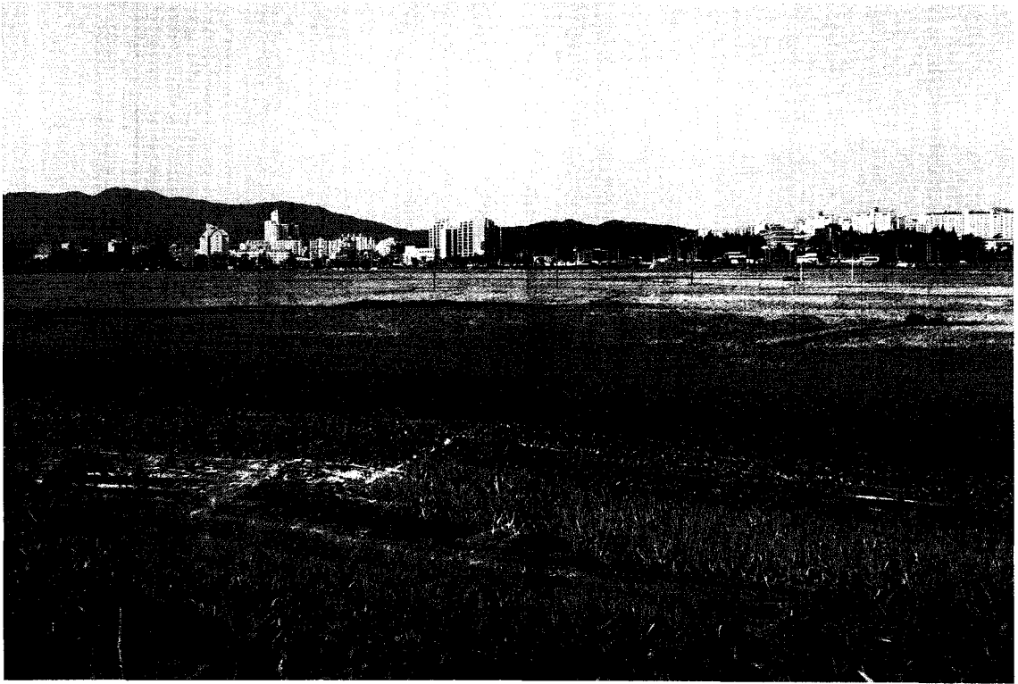
〈그림 8〉 북하천변 구만리들 전경 : 넓은 들에 익은 곡식이 황금물결을 이룬 모습.