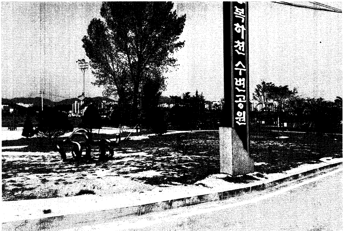
〈그림 5〉 북하1교 좌안부 수변공원 전경 : 북하천변 수변공원은 가족과 친구 연인, 각종 동호회에서 야외활동하기에 최적의 시설로 많은 시민이 이용하고 있다. 삼겹살 구워먹기에 좋아 별명인 삼겹살 공원이다.