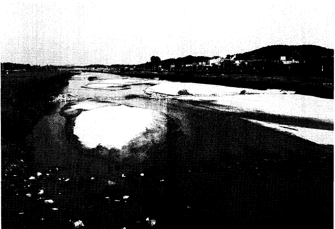
〈그림 3〉 북하1교에서 북하2교 방향 하상전경 : 자연하천의 면모를 보여주는 모래시장이 넓게 펼쳐져 있다.