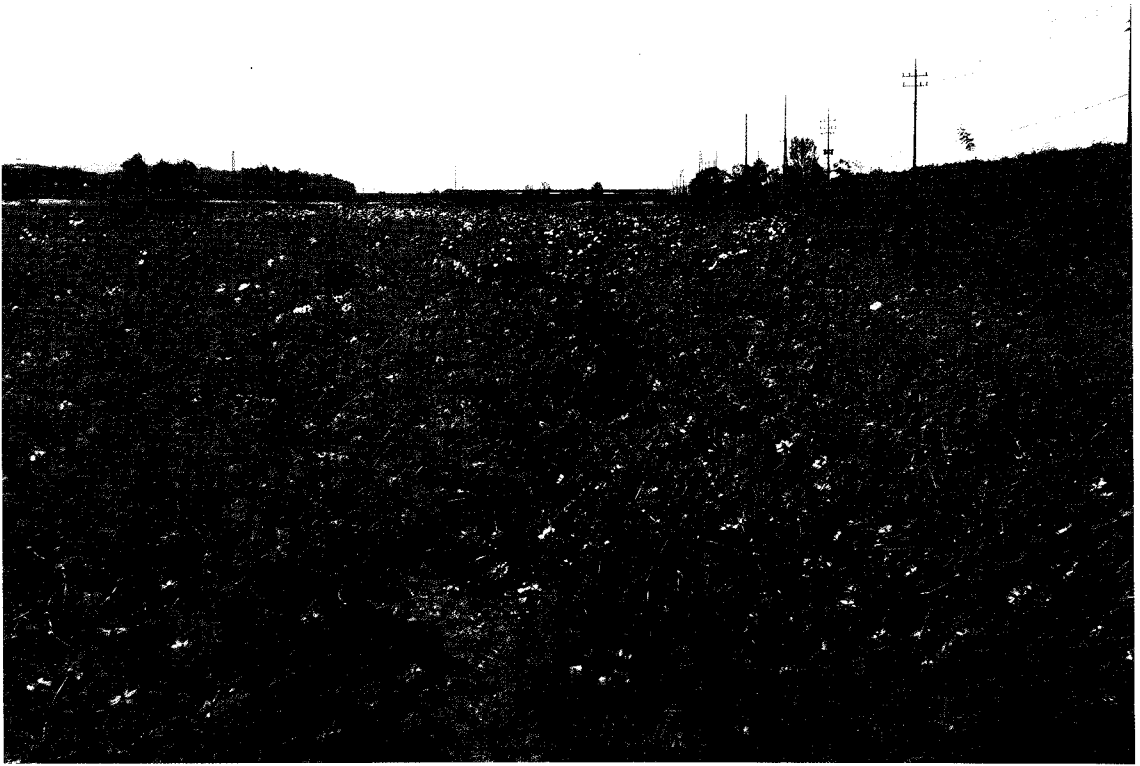
〈그림 4〉 북하1교-북하2교 고수부지 국화, 코스모스 전경 : 고수부지에 철마다 유채, 메밀, 국화 및 코스모스를 심어 많은 이들의 사랑을 받고 있다.