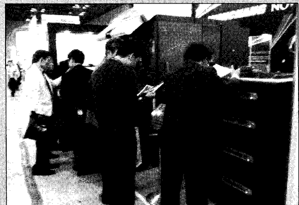
▶한국HP는 인디고 제품군 중 주력 제품인 '7500 디지털 프레스' 와 보급형 제품인 '3550 디지털 프레스' 등을 선보였다.