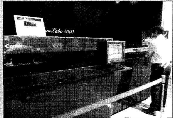
▶캐논코리아비즈니스솔루션은 사무용 잉크젯 프린터 신제품 '드림라보 5000' 를 공개하고 상업용 포토 프린터 시장 진입을 알렸다.