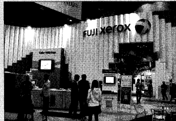
▶한국후지제록스는 분당 100매의 출력이 가능한 '컬러 1000 프레스' 를 통해 명함 솔루션을 시연하며 포토북 솔루션등을 선보였다.