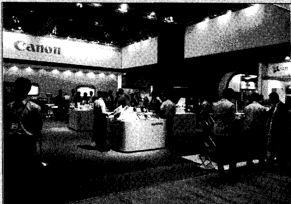
▶이번 전시회의 주제는 '디지털 인쇄로 열어가는 그래픽 세상' 으로서, 각 프린터 업체들은 디지털 인쇄기 신제품을 정면에 배치하고 홍보했다.

김남수 회장은 KIPES 2011 인사말을 통해 “앞으로 종이 인쇄물의 수요가 감소하는 것은 불가피할 것으로 전망된다”며 “이에 대한 대비책으로 IT와 접목한 블루오션을 창출하는 한편 한계를 보이는 국내 시장을 벗어나 해외 시장으로 확대하는 전략을 적극 추진해야 한다”고 강조했다.