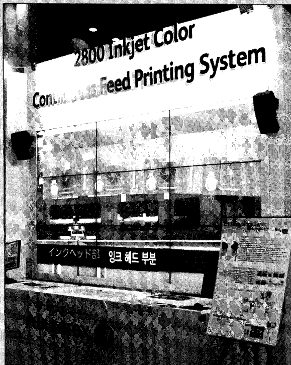
▶한국후지제록스에서 최초로 공개한 잉크젯 방식의 디지털 인쇄기 'FX 2800 잉크젯 컬러 연속지 프린팅 시스템'