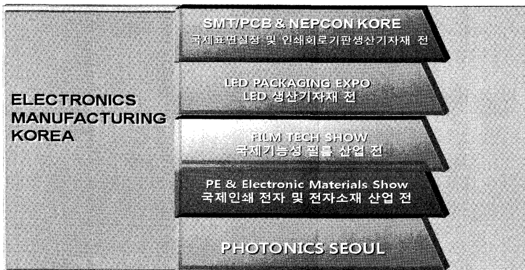
표 2. Electronics Manufacturing Korea 구성