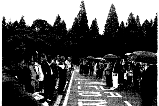
산림환경연구소 답사 전 회원간 인사

평소 봐오던 도심 속의 공공기관의 모습과는 다르게 산림환경연구원 주변은 아름다운 숲과 생태 학습장으로 불릴 만큼 울창한 숲, 그리고 많은 휴식공간으로 소풍을 온 착각이 들 정도로 인상 깊었다. 사계절 내내 훌륭한 자연경관을 연출해 줄 것으로 보일 만큼 완벽한 숲길 속에서 마음이 차분해지며 경주에 오는 동안 지친 회원분들의 피로를 풀어주는 듯 하였다.