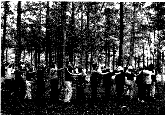
메타세콰이어 숲 체험

산림환경연구원은 산책을 위한 다양한 휴식공간과 아름답게 자리 잡은 생태연못과 정원들이 잘 마련되어 있었고, 자연경관을 훌륭히 살린 조성 탓에 어느 곳에서 촬영을 해도 훌륭한 사진이 나올 만큼 멋스러움을 자랑했다. 짧은 시간 동안 숲 체험을 마치고, 숲 해설가님의 수고에 깊은 감사의 말씀을 전한 후 다음 장소로 이동하게 되었다.