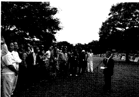
우일조경에서 워크숍 행사