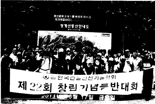
• 협회임직원 전원이 청계산 정상에 오른 창립 22주년 기념등반.

협회는 지난 6월 17일 청계산에서 창립 22주년 기념 등반행사를 가졌다.