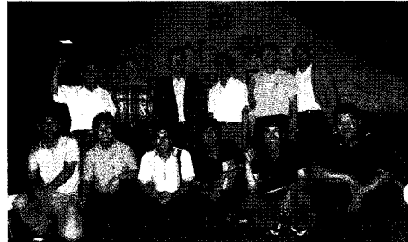
• 제94회 합격자 일행