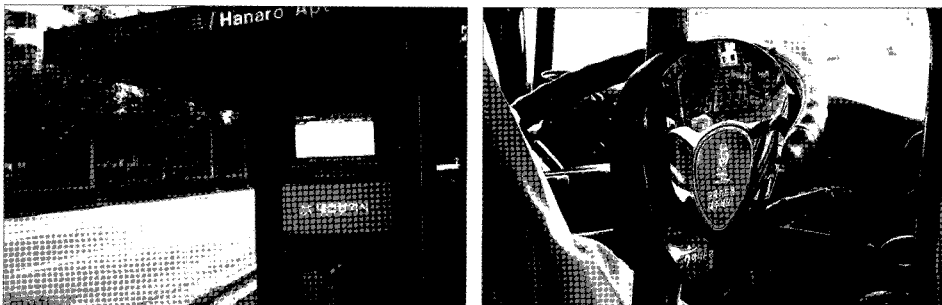
[그림 3] 버스정보시스템

이렇게 이용자적 측면에서 만족스러운 결과를 얻었으나, 한편으로는 아쉬움이 남는