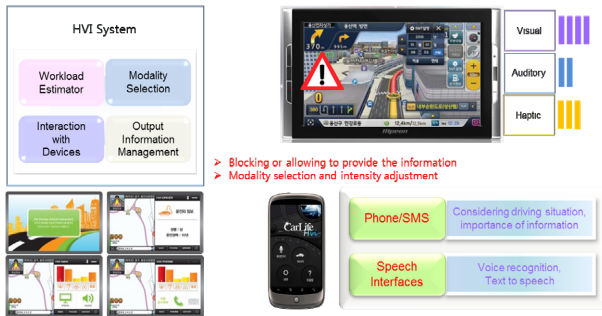
Figure 3. HVI system application

운전자 친화형 지능형 HVI 통합 시스템이 핸드폰과 내비게이션과 연계되어 구성되었고 실차에서 HVI 기능이 수행되는 것을 확인하였다.