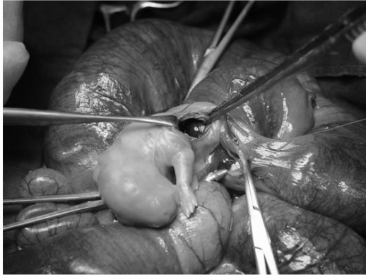
Fig. 1. Photographs showing fetal surgery of creating diaphragmatic hernia in fetal rabbits. Left diaphragmatic hernia was created by excision with microsurgical scissors and liver was herniated.