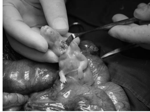
Fig. 2. Photographs showing fetal surgery of tracheal ligation in fetal rabbits. Ligated trachea with clip is shown.

한 뒤 2-0 Maxon으로 복부 절개 부위의 복막과 근막을 봉합하고, 피부 절개 부위는 3-0 Nylon으로 연속 봉합하였다. 어미 토끼를 마취에서 회복시킨 후 사육장으로 보내고 고형 사료와 물을 마음대로 먹게 하였다.