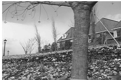
그림 9. 제안된 알고리즘에 의한 복원 영상 Fig. 9 Reconstruction image by proposed algorithm