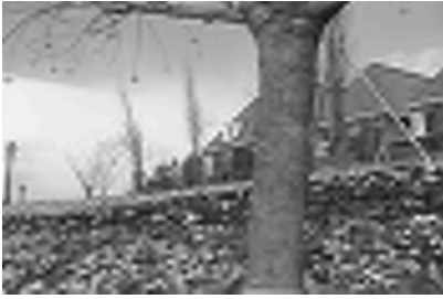
그림 6. 화질 번호 4의 적용 Fig. 6 Application of picture quality No.4