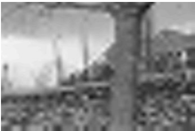
그림 7. 화질 번호 5의 적용 Fig. 7 Application of picture quality No.5