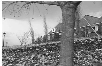
그림 4. 화질 번호 2의 적용 Fig. 4 Application of picture quality No.2