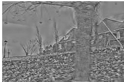
그림 8. FBMA에 의한 복원 영상 Fig. 8 Reconstruction image by FBMA