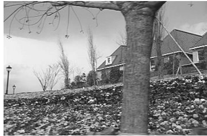
그림 3. 화질 번호 1의 적용 Fig. 3 Application of picture quality No.1

그림 3~7은 정원 영상의 첫 번째 프레임 영상을 제안한 알고리즘의 화질 등급에 따라 적용한 결과를 보여주며 그에 대한 화질과 압축률은 표1과 같다.