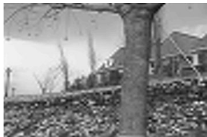
그림 5. 화질 번호 3의 적용 Fig. 5 Application of picture quality No.3