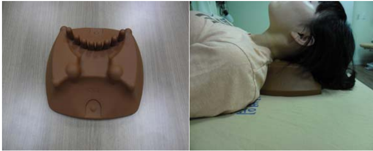
Fig. 4. CST pillow