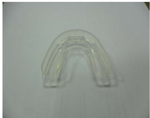
Fig. 3. TBA