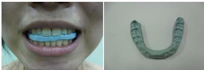
Fig. 1. Balance appliance placed between maxillary teeth and mandibular teeth to adjust the position of the maxilla to induce optimal balance of meridian system and neurological system. Balance appliance was made from vinyl polysilane impression material.