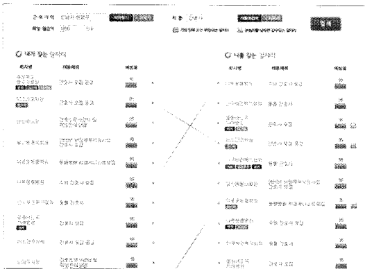
(그림 3) BDFM 서비스 화면

2)의 기존방식과 (그림 3)의 BDFM를 통해 도출된 결과를 모두 사용하게 한 후 만족도를 비교한다. 참여자는 남성과 여성이 각각 14명, 6명의 비율이며, 연령 20대와 30대를 기준으로 웹사이트 사용에 친숙한 IT 종사자를 대상으로 조사한다.