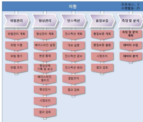
그림 3. 지원 영역의 구성 Fig. 3. Support Area Structure