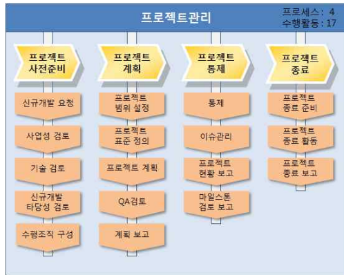
그림 2. 프로젝트 관리 영역의 구성 Fig. 2. Project Management Area Structure

프로젝트 사전준비 프로세스는 신규개발 요청에 대하여 사업적·기술적 타당성을 검토하여 프로젝트 착수 여부를 판단한다. 본 프로세스의 결과에 따라 실제 프로젝트가 시작되며, 산출된 추정, 범위, 위험 등에 대한 데이터는 프로세스 계획 시 기초 데이터로 활용할 수 있다. 프로젝트 사전준비 프로세스는 다음의 5개 수행활동으로 구성되어 있고 '신규개발 타당성 검토서' 등 3가지 산출물을 작성한다.