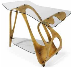
Fig. 15. Carlo Mollino, <Arabesque Table> (1949)