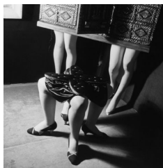
Fig. 4. Kurt Seligmann, <Ultra Furniture> (1938)