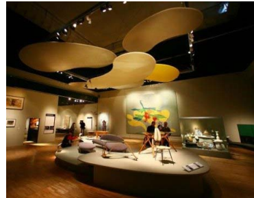
Fig. 18. 초현실적 사물들 전시, V&A Museum (2007)

나타났다. 따라서 유기적 표현 가구들을 세부적으로 분류하여 보면, 자연을 소재로 하는 표현 형태와 추상적 곡선을 모티프로 하는 표현으로 나누어 볼 수 있다. 자연을 소재로 다룬 표현들은 주로 동물을 주제로 하여 표현되었으며, 아르프가 표현한 유기적 형태들은 마치 식물과 아메바의 형태와 유사성을 가지며 디자인 분야에 빠르게 흡수되었다. 추상적 곡선의 표현은 사람의 인체구조를 재해석하여 조형적으로 표현하거나 유기적 곡선을 이용하여 형태의 조형적 표현으로 나타내고 있다. 이러한 유기적 조형언어의 표현은 1940~50년대 이사무 노구치(Isamu Noguchi)의 <Gardens and Playgrounds>처럼 공공예술 프로젝트(Fig. 16)를 통해 발전되었고, 마크 뉴슨(Marc Newson), 론 아라드, 블라디 라파포트(Vladi Rapaport)의 가구처럼 현재까지도 그 영향이 나타나고 있다(강형구, 2010).