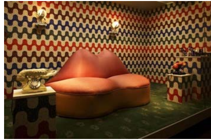
Fig. 17. 초현실적 사물들 전시, V&A Museum (2007)