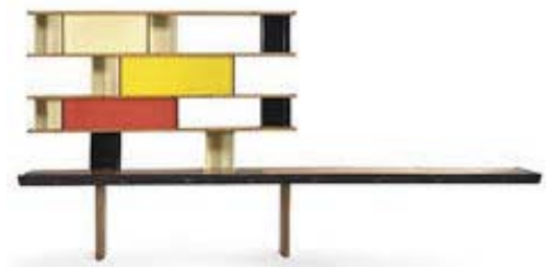
Fig. 11. Design by Charlotte Perriand, Painting by Sonia Delaunay, <Bench and Bookshelf> (1952)

동에 참여했던 소니아 들로네(Sonia Delaunay)는 1952년 샤롯데 페리앙(Charlotte Perriand)이 디자인하고 장 프루베(Jean Prouve) 공방에서 제작한 튀니지 저택 서재가구의 색을 담당하며 자신의 순수 예술작품에 표현한 색채와 개념을 가구에 적용시켰다(Figs. 10, 11).