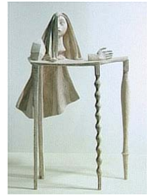
Fig. 6. Diego Giacometti, <Table> (1933)

가구에서 잘 나타나고 있다. 노구치는 기능이 있는 조각 작품을 추구하며 디자인에 예술적 상상력이 왜 포함되어져야 하는지에 대해 고민하였다. 형태의 결정이 기능이라는 제한된 범주를 뛰어 넘고, 기능의 발명은 창조적 예술행위와 같은 것이라 생각하였다(Alfred Barr, 1936). 디에고는 ‘조각된 가구’로 자신의 조각 작품과 유사한 가구들을 제작했는데, 금속의 낡고 부식된 느낌이나 눈이 비어 있는 하얀 석고 얼굴상들은 마치 고대 로마의 건축 양식과 같은 느낌을 주고 있다. Fig. 7에서 나타난 조각적 표현은 부조리한 현실의 외면 속에서 인간의 모습을 가는 선으로 표현했던 자신의 조각품의 표현방법을 가구에서도 그대로 나타내고 있음을 알 수 있다. 오펜하임의 <새의 다리를 한 테이블>은 자연의 이미지 가운데 새의 형태를 이용하여 가구를 제작하였는데, 이 작품은 이후 마오리(Maoli)라는 작가가 오마주(homage)형식으로 제작하기도 하였다. 세바스찬 마타는 대량생산되는 드럼통을 오브제로 사용해 옥좌의 형태로 보이는 “위조된 레디메이드(counterfeit ready-made)”를 묘사한 가구를 선보였다. 이러한 표현은 가구의 예술적 가치를 높여주고 인간의 생활환경에서 가구가 무엇을 할 수 있는가에 관한 폭넓은 범위의 가능성을 탐구하는데 중요한 표현 수단으로 새로운 의미를 가진다(Figs. 5~9).