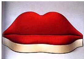
Fig. 1. Salvador Dalí, <Mae West> (1936)

가구에서 초현실주의의 조각적 표현은 초현실주의 작가들이 자신의 순수 예술작품에서 표현한 개념들을 가구라는 매체로 표현한 것으로 이사무 노구치(Isamu Noguchi), 디에고 자코메티(Diego Giacometti), 메레 오펜하임(Meret Oppenheim), 로베르트 세바스찬 마타(Roberto Sebastian Matta)들의