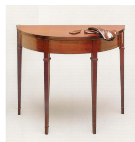
Fig. 13. Wendell castle, <table with Cloves and Keys> (1981)