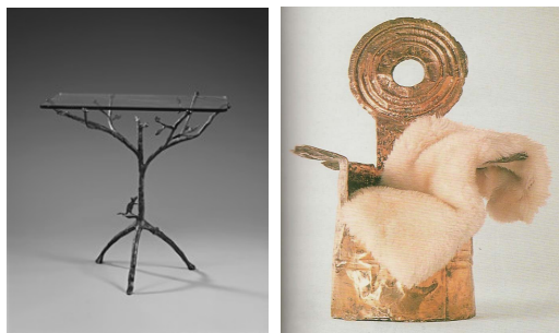
Fig. 7. Diego Giacometti, Fig. 8. Roberto Sebastian Matta, <Margarita> (1970)