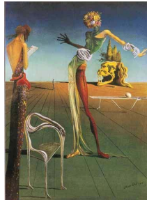
Fig. 2. Salvador Dalí, <Woman with a Head of Rose> (1935)