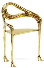
Fig. 3. Salvador Dalí, <Leda Armchair> (1937)