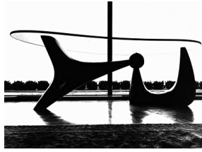
Fig. 5. Isamu Noguchi, <Table for A. Conger Goodyear> (1939)