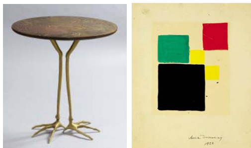
Fig. 9. Meret Oppenheim, Fig. 10. Sonia Delaunay, <table with Bird's Legs> (1939)