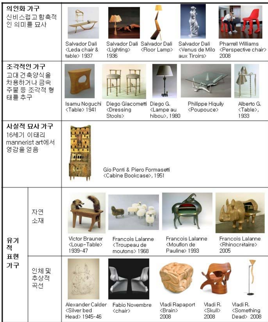
Table 1. Classification of Surrealism Expression in Furniture Design

순수미술에서 시작된 초현실주의는 이처럼 가구를 중심으로 디자인의 모든 분야에 많은 영향을 주었고, 현재까지도 그 영향력이 미치고 있음을 알 수 있다. 특히, 가구분야에서는 초현실주의자들이 자신의 예술적 개념과 표현 형태들을 가구라는 매체를 이용해 나타내고 있었다. 그리고 그 표현양식들은 의인화적 표현, 조각적 표현, 사실적 묘사, 생체적 표현들로 나타나고 있다. 이들 네 가지 표현 형태에 따라 가구를 분류해 보면 Table 1과 같다.