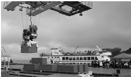
〈그림 2〉 컨테이너 상·하역 시연성공

축하기 위해 해상에서 컨테이너선과 도킹 후, 고속정밀하게 컨테이너를 상하역하여 부두로 이송하는 도전적 원천기술이 적용된 세계 최초의 해상운송수단을 연구 중에 있으며 이 결과로 세계최초 ZM(Zero Moment) 크레인 및 선박간 자동도킹 시스템을 개발(2009년)하였고, 이를 바탕으로 실용화 기술을 개발(2010년)하여 원천기술의 시스템 통합(System Integration), ZM크레인, 자동도킹시스템 상세설계 및 제작을 하고 있으며, 올 2011년 7월 부산 부경대학교 부두 앞 해상에서 시제품 해상 종합시연을 성공리에 마쳐 상용화 가능성과 안정성·신뢰성을 확보하였다.