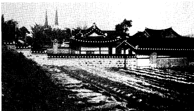
생가 안에서 본 대문 밖 모습