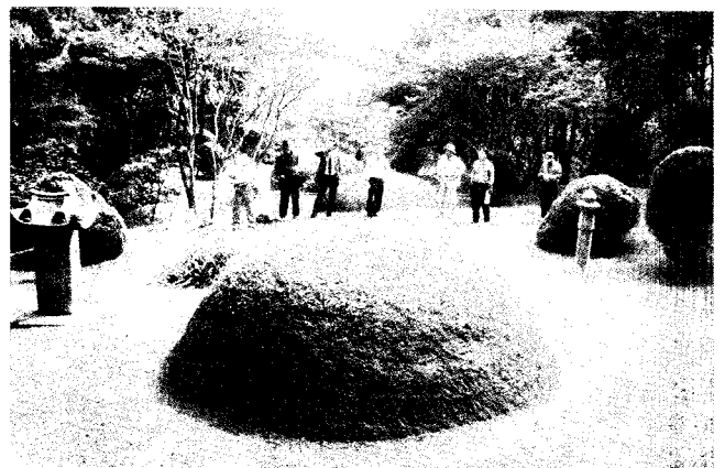
윤보선 전 대통령 고조부 묘

외형상으로도 명당의 요소를 두루 갖추고 있다. 용(龍), 혈(穴), 사신사(四神砂), 물(水)이 그것인데 산맥을 용이라고 볼 때 이 곳은 용의 자궁에 해당된다. 그렇기 때문에 여기다 조상을 묻으면(씨를 뿌리면) 용(임금)이 태어난다. 입수(入首: 산소에서 머리가 처든 곳으로 여자의 음핵에 해당)와 선익(볼록한 부분아래 움푹 패여 쏠린 곳)도 분명하다. 산 아래 물의 흐름이 산소의 축과 반대방향(逆水: 물을 만나야 명당)이며 수구(水口: 사람의 항문에 해당, 좁혀 있어야 명당) 또한 좁게 되어있다. 물은 생명의 원천이고 산은 기의 원천으로 이 둘이 만나 생기(生氣)를 이루게 된다.