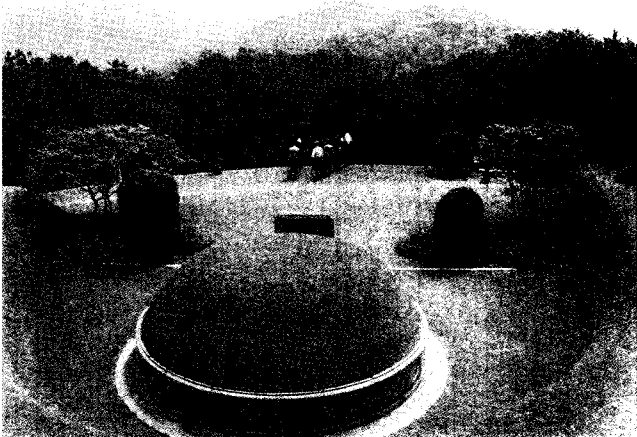
윤보선 전 대통령 묘소

산소는 맨 위에서부터 윤보선 대통령과 영부인 공덕귀 여사 묘소 그리고 아래로 고조부 협판공 득실 내외 묘 등 전체 6기가 축을 이루며 일렬로 위치하고 있다. 계단을 통해 오를 수 있는데, 윤 대통령 묘소부터 올라가 배례를 하고 풍수의 대가인 박시의 위원장으로부터 현황 설명을 들었다.