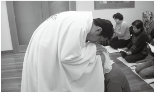
월레미사 - 미사에 참석한 사별 가족에게 강복을 주시는 신부님