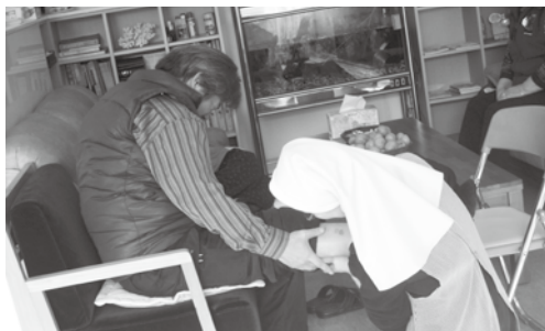
수녀님의 림프 마사지 - 다리 부종이 심한 환자를 위해 직접 마사지 해 주시는 수녀님