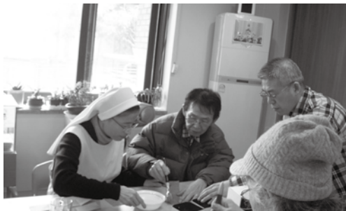
한지공예(미니 서랍 만들기) - 본인이 만든 작품이 완성되는 과정 속에 작은 즐거움을 느끼는 환자분들