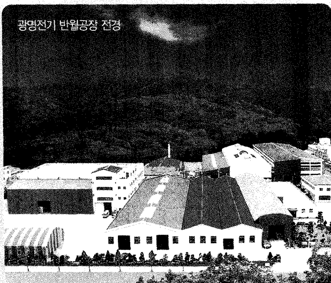
광명전기 반월공장 전경