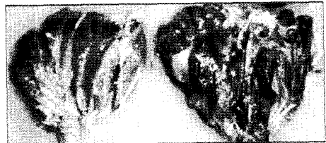
(국내산) 닭고기 (수입산)