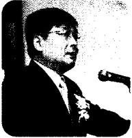
글 박남규 국립과학수사연구소 남부분소 소장