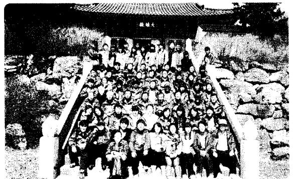
2010년도 직원 직무교육 실시