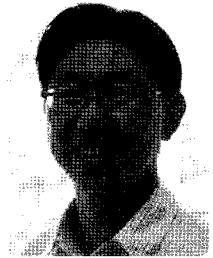
이 명 기