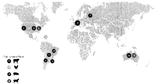
<그림 4> JBS 도축가공장

이와 같은 인수 합병을 통해 최대 육류 생산국들인 브라질, 아르헨티나, 호주, 미국, 이탈리아 등에 생산기반을 확보하였다. 한편 브라질 정부는 세계시장에 수출하기 위한 강력한 위생안전 기준을 마련하여 운영하고 있다. 소 사육 농가는 정부의 위생안전 기준을 충족해야만 소를 판매할 수 있으며, 정부는 매년 검사를 통해 소를 팔수 있는 농가 목록을 작성하고 있다.