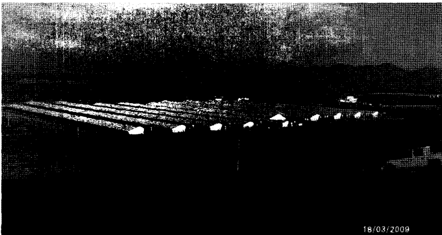
<그림 3> 후아스코 지역 모돈농장

할 계획이며, 프로젝트의 첫 단계로 대규모 과수원, 축산 농장, 수출용 농축산물 가공 처리장 등 농축산업 기반 시설을 건설하고 있다. 이 사업을 통해 5년 내에 3천여명의 지역 고용 증대효과를 기대하고 있다.