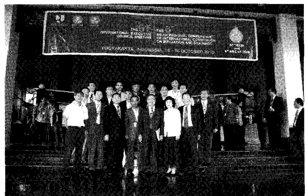
Member of participation