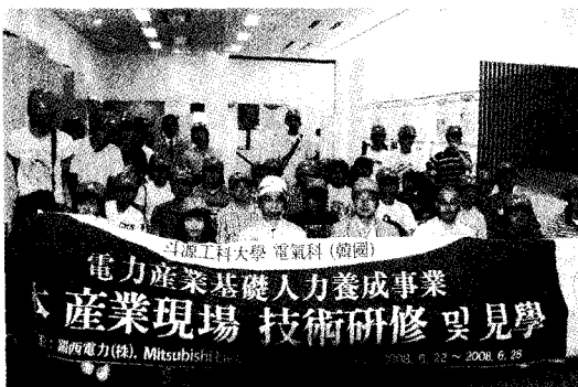
[그림 2] 일본 Mitsubishi Electric 견학 연수