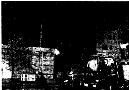
〈사진 1〉 소방대 도착 시 현장 장면

소방차 등 60여 대 차량과 헬기 1대가 진화작업과 연소확대 저지작업을 펼쳤고 화재초기 피