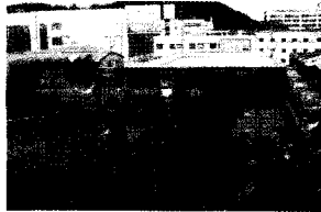
〈사진 5〉 공장내부 및 연소확대 현장

난이 이루어져 인명피해는 없었다. 강한 바람으로 인해 인접공장으로 화재가 전파되어 1개 공장동이 전소되고 소방대의 연소확대 저지로 더 이상의 확대 없이 진화하였다. 연소확대 상황은 바람이 불어오는 쪽 인접공장은 이격거리가 1미터 미만이었는데 벽체 일부 소실 정도였지만, 바람이 불어가는 쪽 인접공장은 5미터 정도의 이격거리와 벽돌조적 벽체였음에도 바람의 영향으로 계속되는 복사열의 공급으로 채광창이 있는 철판지붕 쪽으로 화재가 전파되어 공장동이 전소되었다. 발화공장은 2층이었으나 4층 높이로 높게 지어진 건물이었고 인접 인쇄기판 공장의 낮은 2층 건물이었기 때문에 강한 복사열에 천장이 계속 노출됨에 따라 화재가 전파되었다.