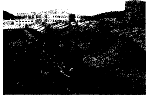
〈사진 7〉 바람이 불어가는 쪽 공장 연소확대 현장