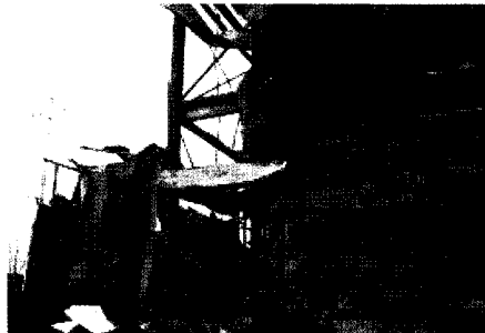
〈사진 3〉 스티로폼 심재가 녹아 패널 철판만 남은 발화장소