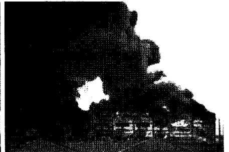
〈사진 2〉 연소확대 이전 현장 후면