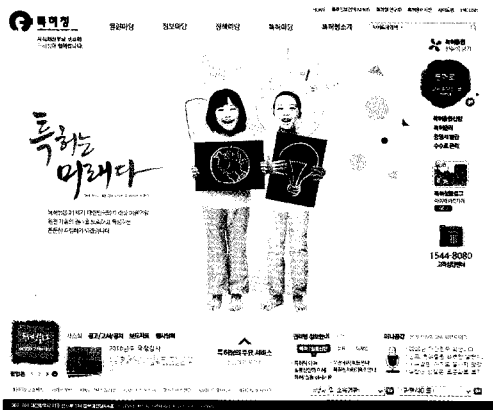
← 국문 홈페이지 첫 화면

또한, 홈페이지 내(內) 메뉴별 접근경로를 단순화하고 통합검색 기능을 강화하였으며, 네이버(Naver), 다음(Daum) 등 포털 사이트에서도 특허청 홈페이지 정보가 검색될 수 있도록 개선하였다.