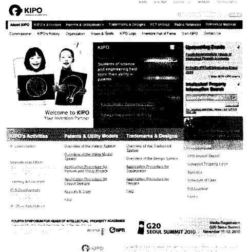
→ 영문 홈페이지 첫 화면