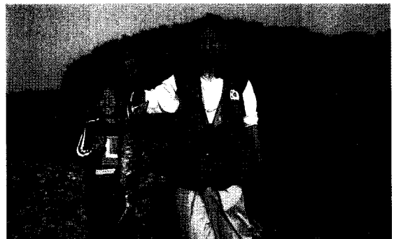
〈그림 4〉 필자와 연어