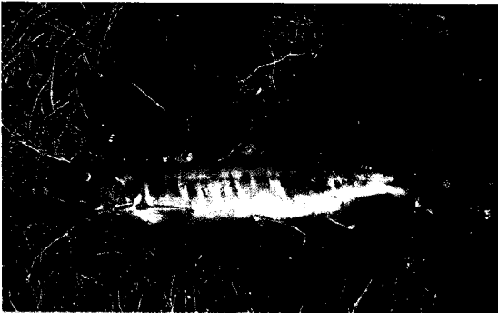
〈그림 1〉 연어

고아 되는 새끼 질러놓고 어이 같거나 두 눈 부릅뜨고 아가리를 딱벌리고 이 한(恨) 끝으로 붉은 구슬 염주알 물에 굴리며 하늘로 거슬러 올라가는 남대천 연어 🐟