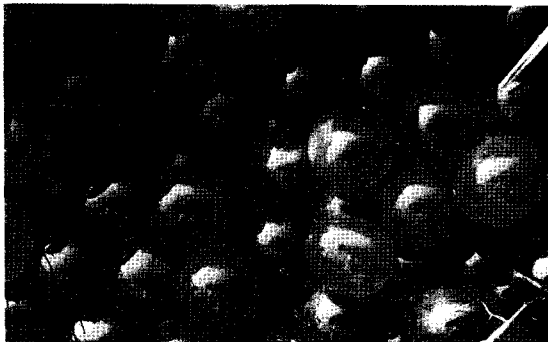
〈그림 3〉 연어 알