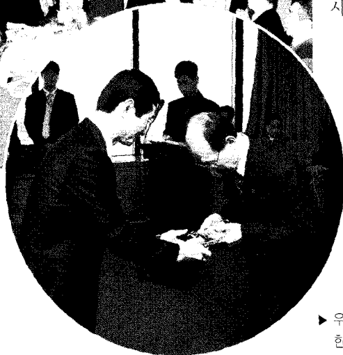
▶ 우리회 최종협 상근부회장이 한국발명원 원인호 회장에게 감사패를 증정하고 있다.

이어, 2009년 사업실적 및 결산 · 2010년 사업계획 및 예산 보고가 이루어졌다.