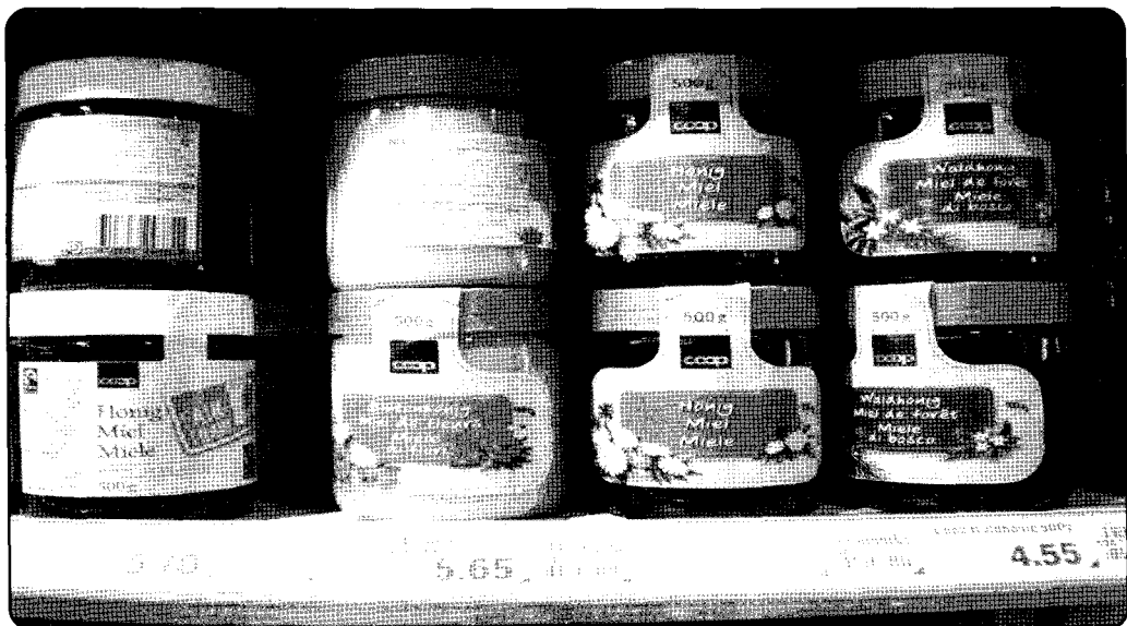
▲ 프랑스 마트내 벌꿀 진열상품 (가격참조)

셀베레 지역 협업기관이 생산한 라벤더 벌꿀은 400g에 2000원입니다. 살세스, 파지올 지역의 협업기관이 생산한 로마린 벌꿀은 갈숨이 풍부하고, 항바이러스성 기능이 있다고 알려져 있으며 500g에 12,800원에 거래되고 있습니다. Pla지역과 Capcir지역의 산간지역에서 자라는 철쭉꽃, 화이트 클로버, 산딸기가 밀원이며 꿀