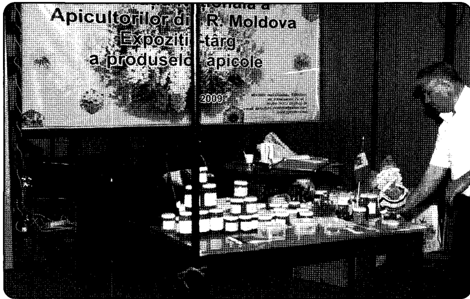
▲ 현지 양봉농가에 전시된 양봉산물

은 결정이 빠르게 진행되며 저장성이 뛰어나고, Oligo-요소가 균등하게 담겨있어 면역기능을 보강해 준다고 합니다. 가격은 500g에 12,800원 입니다. Tilleul벌꿀은 500g에만 3000원이며 Counozouls 지역 협업기관이 생산합니다. Aroma의 멘솔, 발삼성분이 포함되어 있습니다.