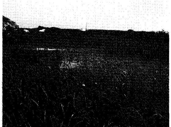
〈그림 4〉 자생지 버들붕어가 등뿔 살고 있는 경기도 김포시 어디쯤에 흐르는 수로. 최근 오염과 남획으로 그 서식처가 점점 줄어들고 있어 보호대책이 필요하다.