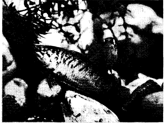
〈그림 2〉 버들붕어 암수 여러 나라에서 관상어로 기를 정도로 아름다운 우리나라 물고기다. 번식기에는 수컷끼리 세력권을 차지하기 위해 썸박질을 한다. 중국에서는 鱖魚(투어) 시합용으로 인기가 있다.