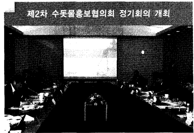
제2차 수돗물홍보협의회 정기회의 개최

● 지난 11월 16일 제2차 수돗물홍보협의회 본부장 회의가 2009 WATER KOREA 개막 첫날 송도컨벤시아에서 열렸다. 안문수 상하수도정책관, 이정관 서울시 상수도사업본부장 등 협의회 회원 8인 및 협회 상근회장이 참석한 이날 회의에서는 2009년 사업 추진결과 보고 및 예산결산이 있었고, 2010년 수돗물 공익광고사업 및 인식조사 등 2건의 계속사업과 수돗물 중장기 홍보전략 수립, 수돗물 홍보전문가 지원단 구성 및 운영 등 신규사업 3건에 대한 심의와 의결이 진행됐다.