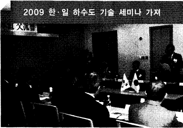
2009 한·일 하수도 기술 세미나 가져

● 지난 11월 17일 한·일 하수도 기술 세미나가 송도컨벤시아에서 개최됐다. 일본 국토교통성과 일본하수도협회 하수도 전문가 및 관계자가 참석한 이 자리에서는 우리나라보다 앞서 디스포저(Disposer, 주방용 오물분쇄기)를 도입한 일본의 현황 및 문제점, 향후 계획과 서울시의 디스포저 시범사업 등에 대해 심도 있는 의견 교환이 이뤄졌다. 또한 매년 정기적으로 개최되고 있는 이번 세미나에 동아시아 전역이 참여할 수 있도록 아시아 지역 네트워크를 구축(EAST ASIA PLATFORM)하는 방안도 활발히 논의됐다.