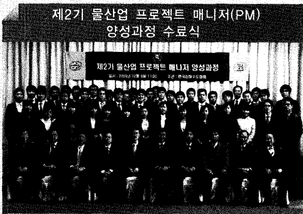
제2기 물산업 프로젝트 매니저(PM) 양성과정 수료식

● 환경부와 우리 협회가 미래 신성장 동력으로 떠오르고 있는 물산업 분야의 청년리더를 양성하고 청년실업을 해소하고자 추진중인 '물산업 프로젝트 매니저 양성과정' 2기 수료식이 지난 12월 9일 거행됐다. 이날 수료식에는 4개월 가량 물산업 분야의 기초 역량과 프로젝트 매니저로서의 비즈니스 역량 배양을 위한 집중 트레이닝 과정을 마친 48명의 교육생이 참석하여 수료증을 전달 받았다. 기업 인턴과정을 마친 교육생들은 교육과정 중 습득한 지식과 역량을 기반으로 향후 각 기업체로 진출해 핵심 분야에서 중추적인 역할을 수행하게 될 전망이다.