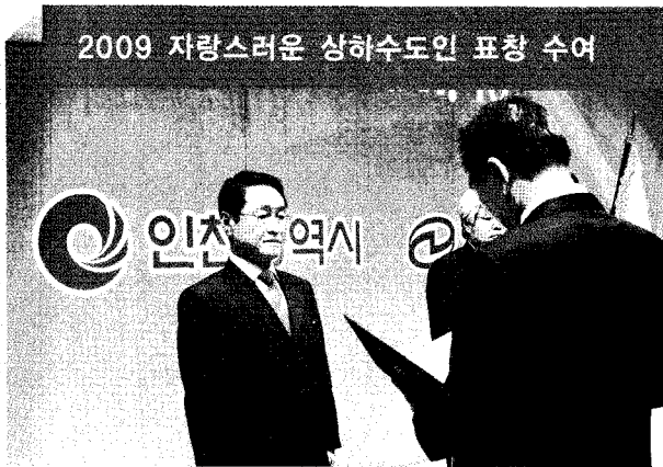
2009 자랑스러운 상하수도인 표창 수여

● 지난 11월 16일 송도컨벤시아 프리미어볼룸에서 안상수 인천광역시장 등이 참석한 가운데 상하수도 분야 발전에 공헌한 이들을 선정하는 2009 자랑스러운 상하수도인 표창 수여식이 거행됐다. 2009 WATER KOREA 개막 첫날 열린 '상하수도인 밤' 행사에서 200여 명의 상하수도 분야 종사자들이 참석한 가운데 진행된 이날 수여식에서는 대통령 표창, 국무총리 표창, 환경부장관 표창, 행정안전부장관 표창, 국토해양부장관 표창, 한국상하수도협회장 표창 등 총 95명이 선정되어 수상의 영예를 안았다.