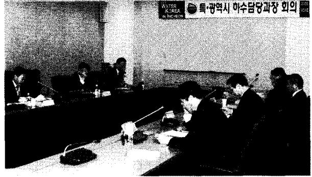
특·광역시 하수담당과장 회의 개최

● 지난 11월 17일 2009 WATER KOREA 기간 중 송도컨벤시아에서 '특·광역시 하수담당과장 회의'가 열렸다. 인천광역시 주최로 진행된 이날 회의에서는 7개 특·광역시 하수담당 과장들과 환경부 생활하수 과장이 참석해 전문적인 기술교류의 시간을 가졌다. 이날 회의에서는 하수도 요금 현실화를 위한 중앙정부의 하수도 요금 가이드라인 제시 필요 및 특·광역시 공통수준의 요금 산정과 관련하여 심도 있는 논의가 진행됐다. 또한 에너지 절약을 위한 시범 설치 사례 공유의 필요성을 공감하는 등 다양한 현안에 대해 의견교류가 이뤄졌다.