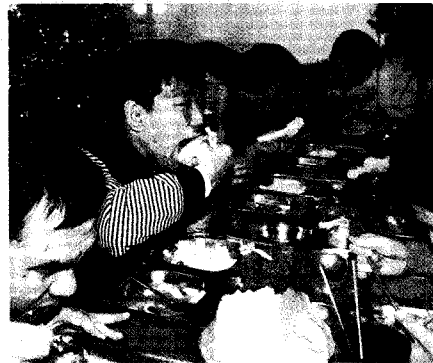
① 가리따스 방배종합복지관에서 배식 모습 ② 양재노인복지센터에 오리고기 주물럭이 메뉴에 올랐다. ③ 맛있게 식사중인 은광학교(광명원) 원생들 ④ 애일에 집에 오리고기 전달 ⑤ 광주장애인종합 복지관 보호작업장에서 오리고기 전달식 ⑥ 은광학교(광명원) 전경

우리 협회에서는 연말을 맞이하여 불우이웃과 노숙인 등 소외된 이웃들에 오리고기를 후원하는 행사를 가졌다.