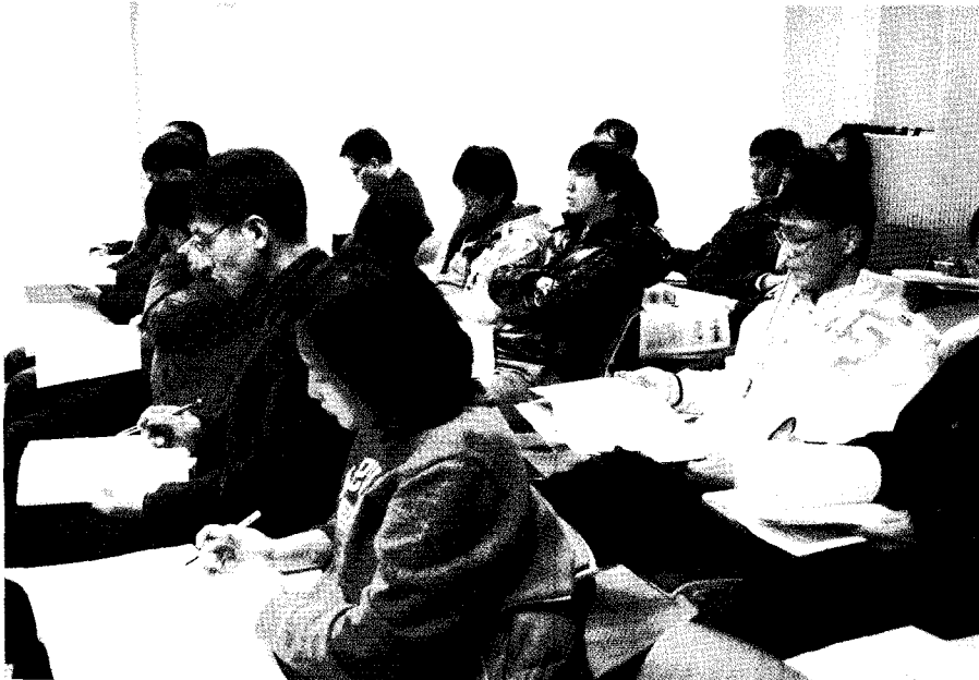
▲ 기업의 품질관리 담당자들이 규격해설 설명에 대해 경청하고 있다.