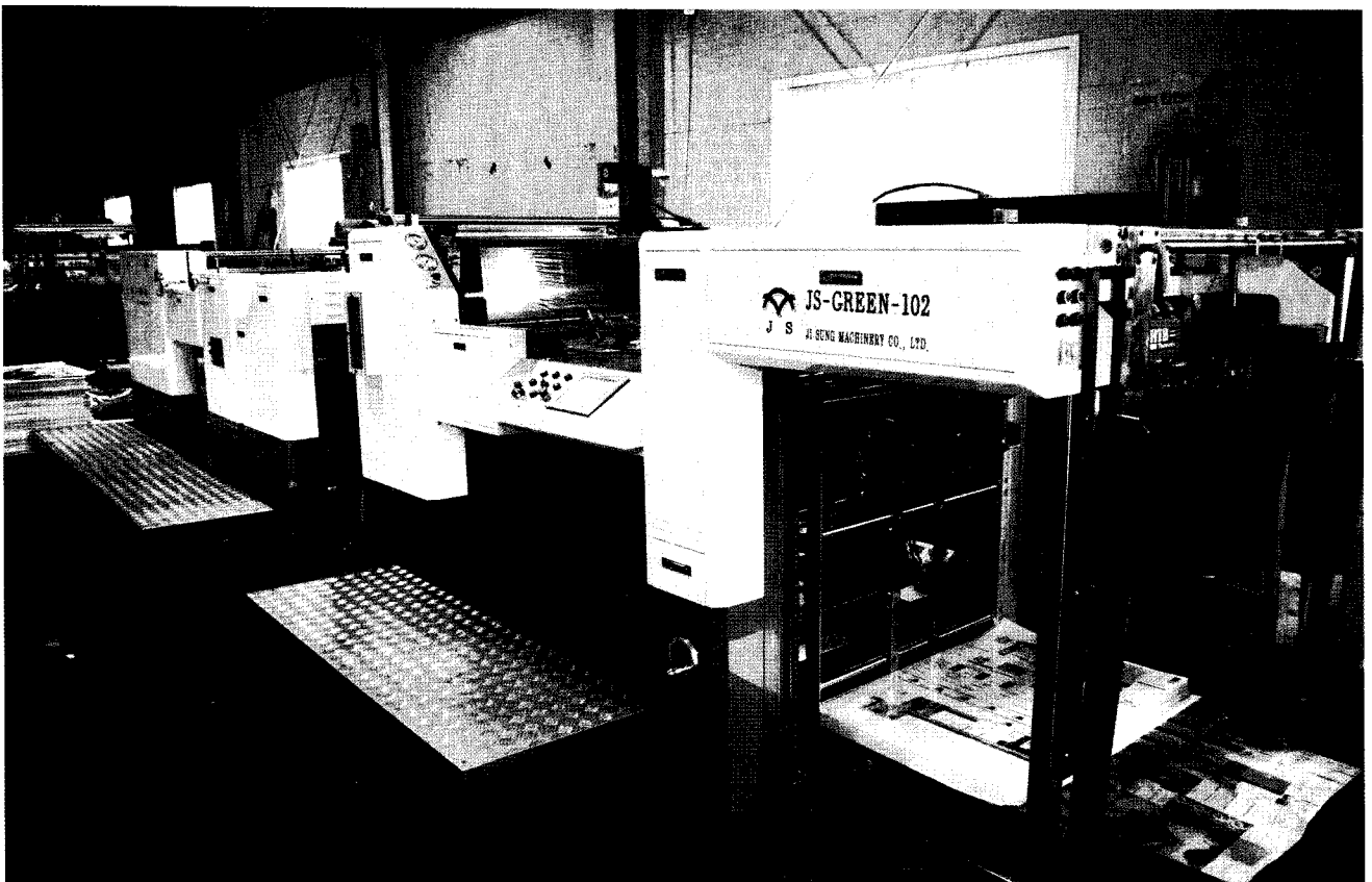
| JS-GREEN 102

저희는 전시회를 통해 나름대로 세계 시장의 기술 흐름과 함께 하고 있다고 자신합니다. 아시아권에서 중국의 값싼 기계에 밀려 고전을 하고 있긴 하지만 기술개발에 전력을 다해 제값 하는 기계라는 이미지를 심을 수 있도록 노력할 것입니다.