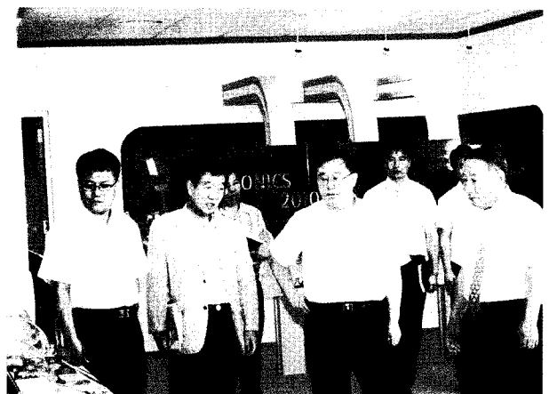
▲ 지난 8월 3일 첨단단지 연구·지원기관 방문하여 업무현황을 파악하였으며, 위의 사진은 광산업전시홍보관을 둘러보고 있는 모습임.