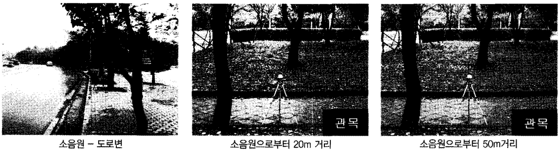
표 1. 소음원과 거리 따른 녹지구성별 소음감소 효과

수목에 의한 도시 환경개선을 위해서는 다양한 수종에 대한 환경형성기능 평가가 이루어져야 할 것이다.