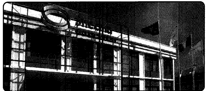
프랑스 Gennevilliers에 위치한 스네크마 본사 전경

스네크마의 전신은 1905년 Seguin 형제가 프랑스 Gennevilliers에 설립한 'Societe des Moteurs Gnome' 라는 엔진제작사로 설립 후 헬기 엔진부터 개발을 시작했다. 이후 1915년 'Societe des Moteurs Le Rhone' 엔진사와 합병한 데 이어 1945년 프랑스 정부가 엔진사를 국영화 하면서 지금의 SNECMA(Societe Nationale d' Etudes et Construction de Moteurs d' Aviation)로 탄생하게 됐다.