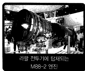
라팔 전투기에 탑재되는 M88-2 엔진

전투기용 엔진이다. 이 외에도 스네크마는 E-3 센트리, E-6 머큐리, KC-135 및 RC-135 등에 탑재된 CFM56-2 엔진과 알파제트 훈련기에 탑재된 Larzac 엔진 등도 개발했다. 최근에는 ITP, MTU Aero