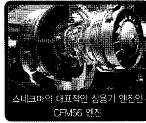
스네크마의 대표적인 상용기 엔진인 CFM56 엔진

1974년 처음 소개된 이후 지금까지 약 2만대가 넘게 납품될 만큼 상용기 시장에서 주요 엔진으로 손꼽히고 있으며, A320 계열기를 비롯해 A340, 보잉 737 등 전 세계 주요 상용기 엔진으로 사용되고 있다. 이 외